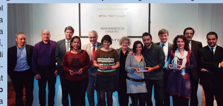
Foto de família dels I Premis periodístics ATLL de l'Aigua