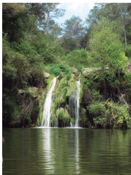
PORTADA: Riera de Caldes (gorg de Les Elies)