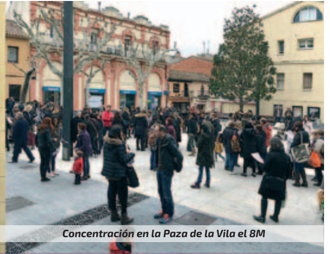
Concentración en la Plaza de la Vila el 8M