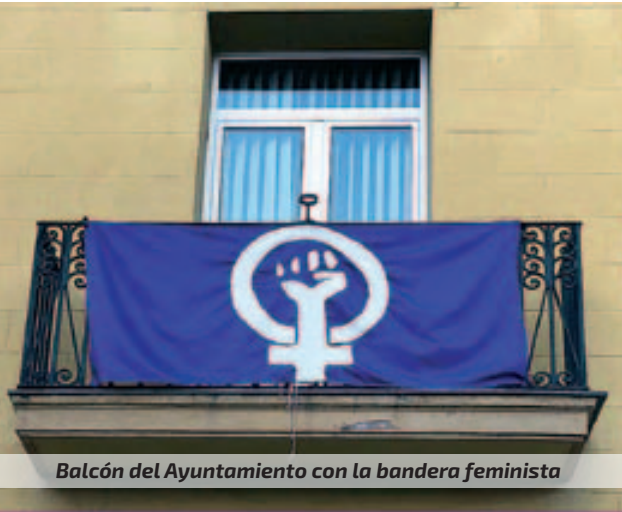
Balcón del Ayuntamiento con la bandera feminista