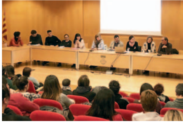
Mesa de la charla sobre educación del 1 de marzo, con representación del alcalde y la concejala del Ayuntamiento, las direcciones y las Ampas de los centros escolares y de un ex alumno del instituto.

En cuanto a actividades de promoción de la salud, este año se llevarán a cabo 43 actividades entre primaria y secundaria (alimentación saludable, higiene postural, primeros auxilios, sexualidad, prevención de conductas de riesgo, etc.). Aparte de proyectos más estables como el de