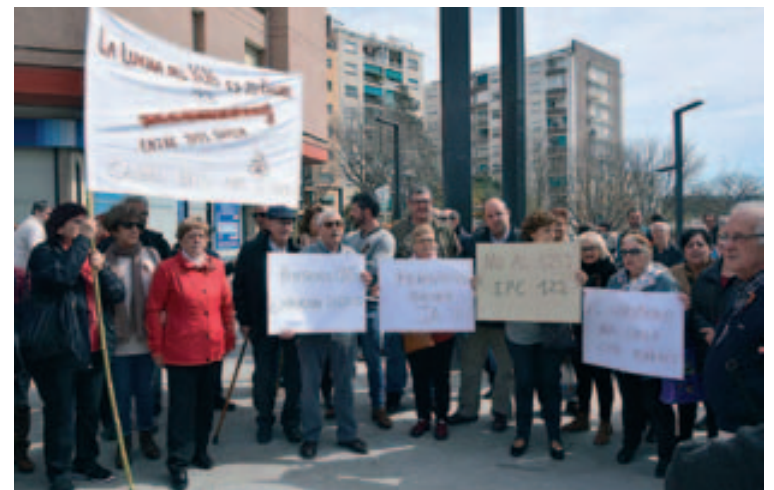
Más de 150 personas, en su mayoría personas mayores, se han concentrado en la plaza de la Vila, este sábado 17 de marzo al mediodía, para protestar por las medidas del Gobierno Español hacia las políticas de las pensiones. La convocatoria ha sido realizada por el Casal de la Gent Gran. La concentración se ha manifestado por la calle Mayor, hasta la plaza de la Quintana.