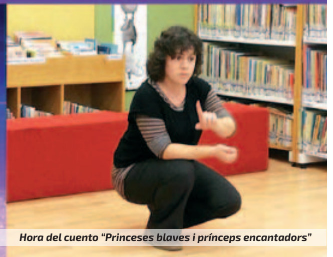
Hora del cuento "Princeses blaves i prínceps encantadors"