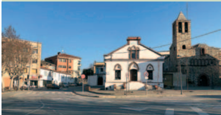
Imagen actual de la zona a reurbanizar