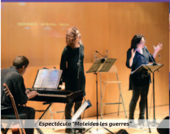
Espectáculo "Maleïdes les guerres"