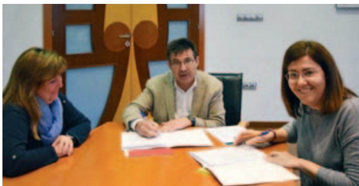
Firma de colaboración entre el CDIAP y el Ayuntamiento de Montmeló

La detección precoz de trastornos o riesgos en el desarrollo es fundamental y este apoyo ayudará en su prevención, detección y tratamiento. ■