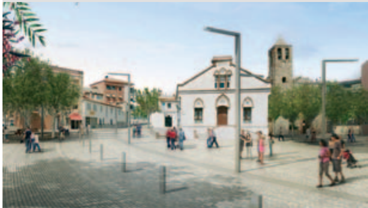
Render del proyecto tal y como quedará el espacio urbanizado

El plazo de entrega del proyecto finalizará hacia finales de junio, para permitir el inicio de las obras en el tercer trimestre del presente año. ■