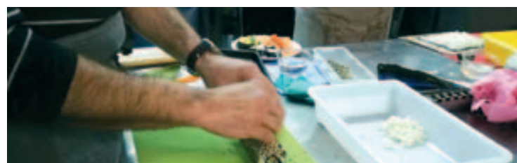
Primer taller de sushi

El Centro Cultural La Torreta ha organizado una serie de talleres monográficos de cocina que se están realizando en las instalaciones del Espai Emprén de la G2M.