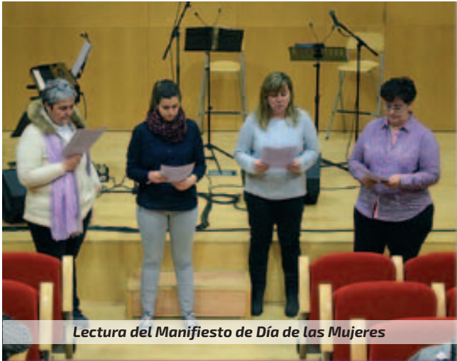
Lectura del Manifiesto de Día de las Mujeres