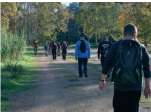
Ruta de les Fonts 2018