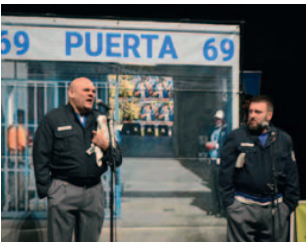
El Derby: més de 550 persones a la Polivalent