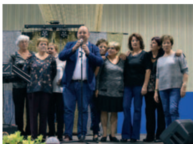
L'alcalde amb la junta del Casal de la Gent gran