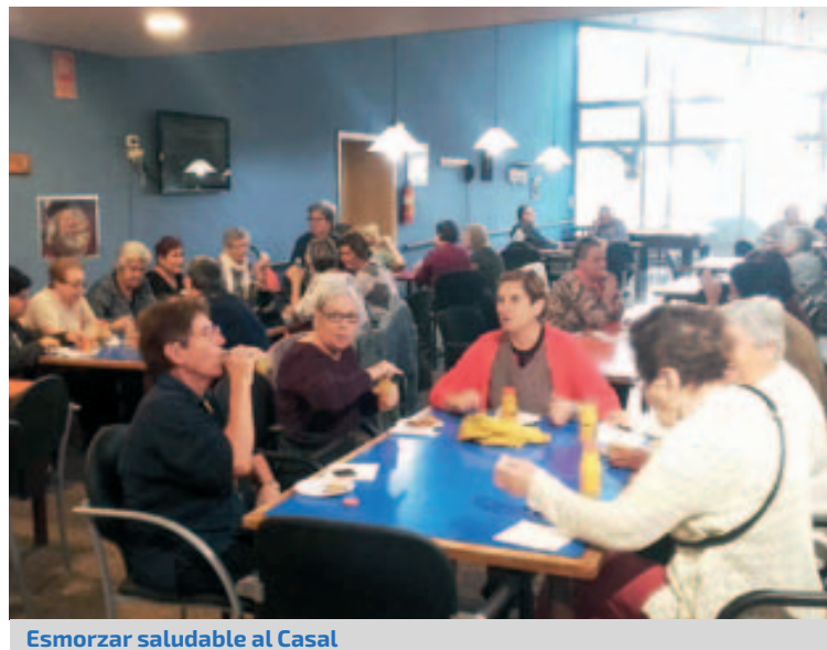
Esmorzar saludable al Casal