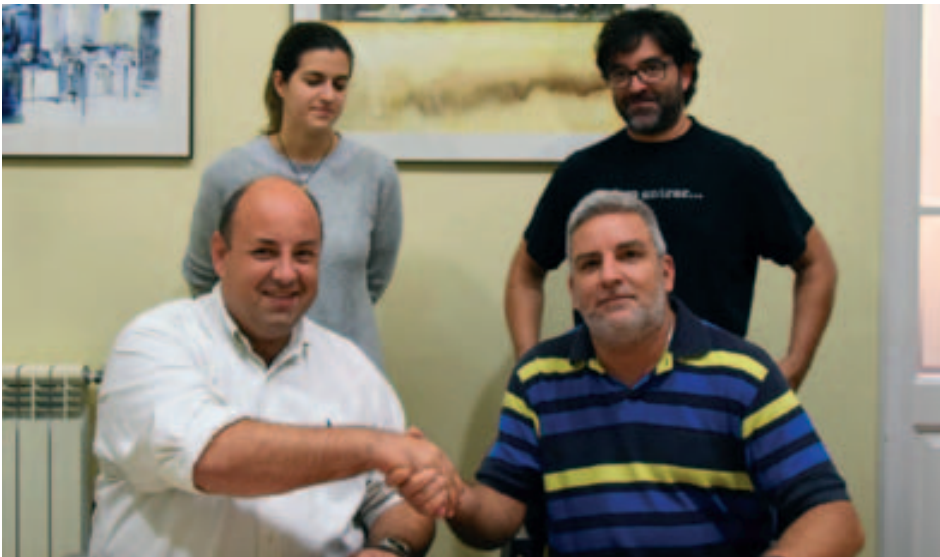
Signatura entre el CF Montmeló UE i l'Ajuntament per a la gestió del bar del camp de futbol