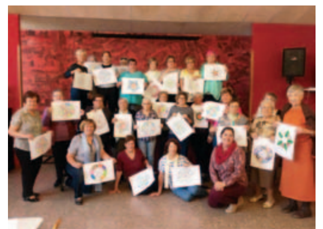
Taller de mandales