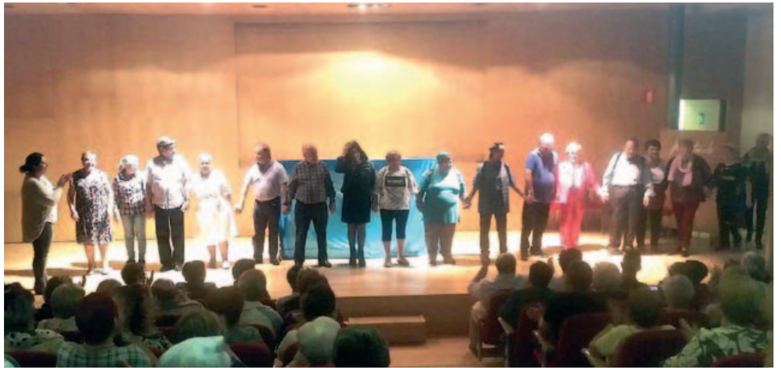
Teatre "Fem comèdia", a càrrec del Casal de la Gent Gran

Entre les activitats que ja són un clàssic es troben els esmorzars saludables del 22 al 28 , un taller de mandales i un de risoteràpia i, el sisè concurs de truites , dissabte 27 d'octubre . L'homenatge de comiat de la setmana de la Gent Gran va finalitzar diumenge, dia 28 d'octubre , amb un dinar amb ball al pavelló municipal . Aquesta activitat compta amb el suport de persones voluntàries del municipi i de tècniques de diferents departaments de l'Ajuntament que col·laboren de manera desinteressada.