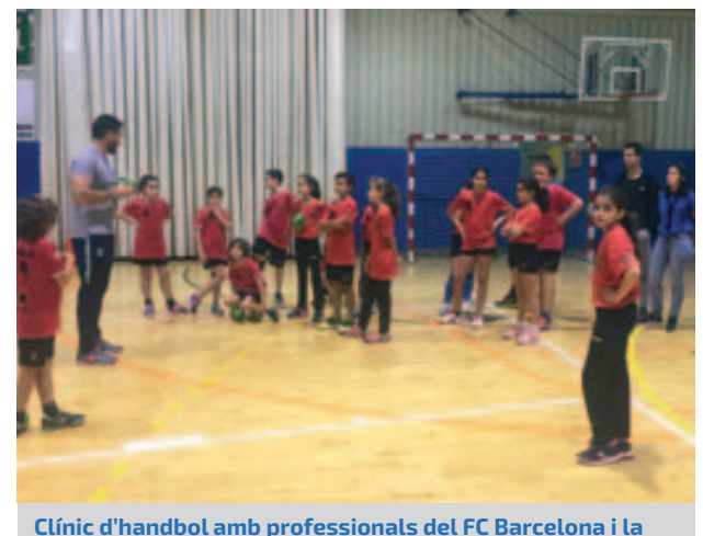
Clínic d'handbol amb professionals del FC Barcelona i la Penya Blaugrana Montmeló de Handbol