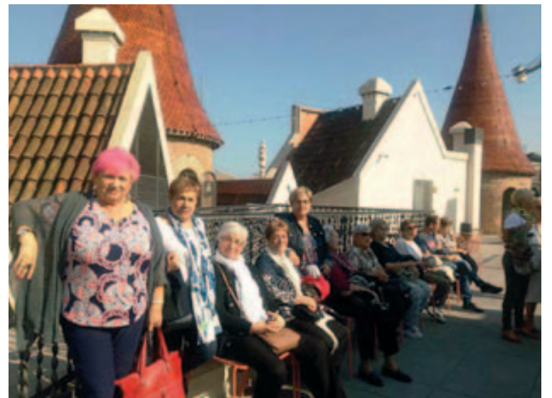
Visita a la Casa de les Punxes, a Barcelona