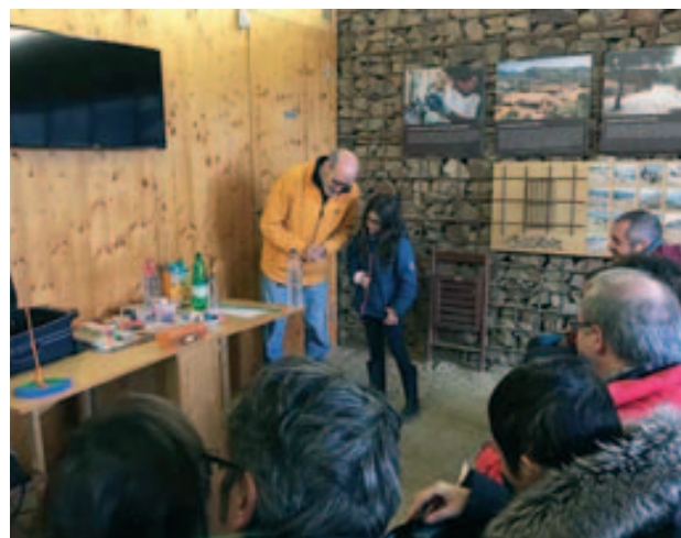
Taller a Mons Observans: Setmana de la Ciència