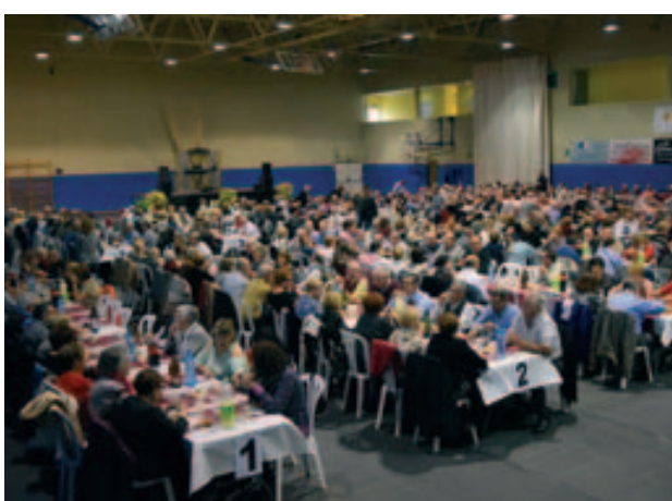
Dinar d'homenatge a la gent gran al pavelló