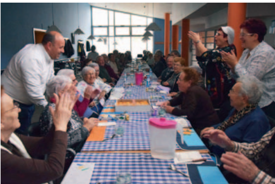
5è aniversari de Dinar en Companyia