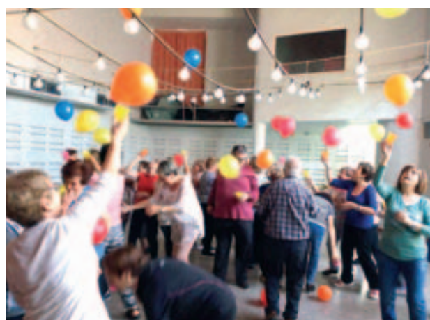
Taller de risoteràpia