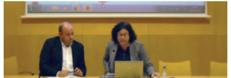
Presentació del portal de Civio: On van els meus impostos?

En el portal es poden consultar les dades de diferents maneres. Es pot tenir una visió global de les despeses i dels ingressos anuals, o bé es pot tenir una visió per polítiques. D'aquesta forma, la ciutadania pot fer en tot moment una comparativa de com ha canviat durant aquests sis anys la distribució pressupostària de l'Ajuntament. A més el portal ofereix la possibilitat de personalitzar les xifres. Des-