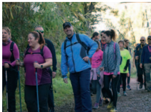
Ruta de les Fonts 2018