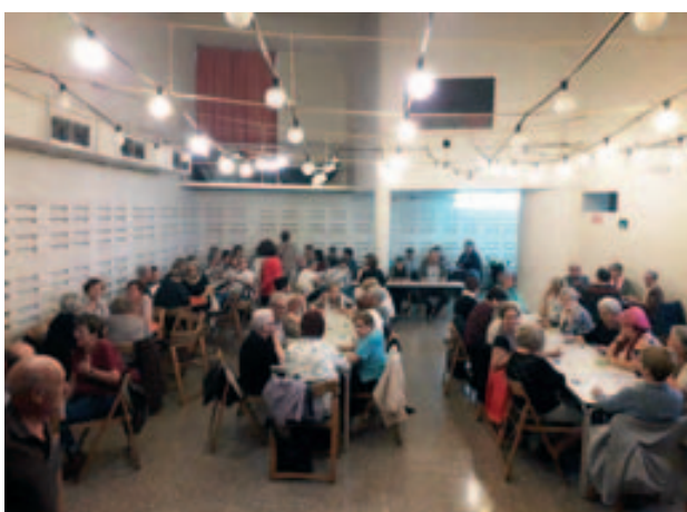
Tarda de Bingo al Casal