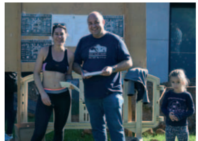
Ruta de les Fonts 2018 – Entrega d'obsequis