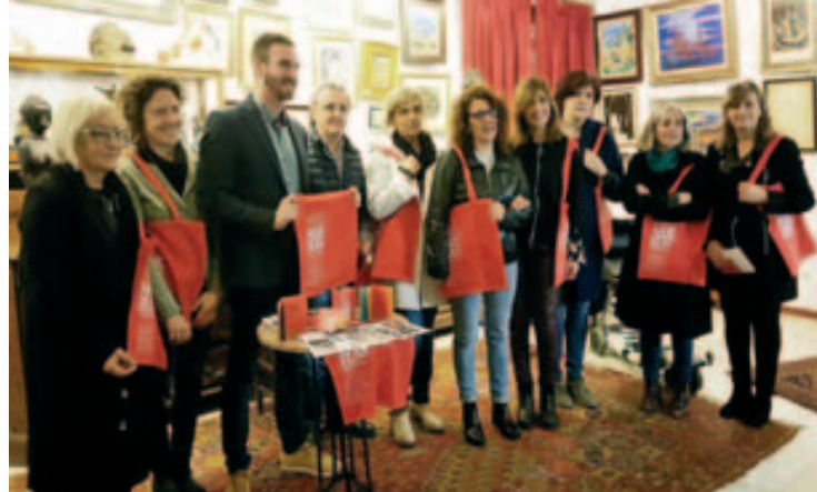
Acte de presentació del Passmuseum a la casa del pintor Abelló de Mollet del Vallès

Aquest programa s'ha concretat en l'edició del llibret Passmuseum que, en forma de passaport, recull l'oferta de cadascun dels museus participants, la qual es pot complementar amb un di-