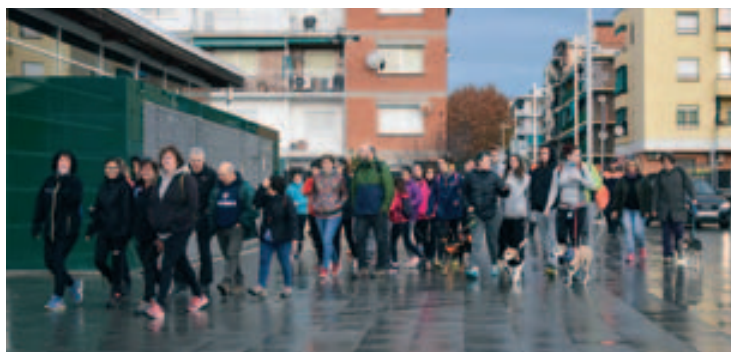
Caminada Solidària organitzada pel Montmeló Club Bàsquet