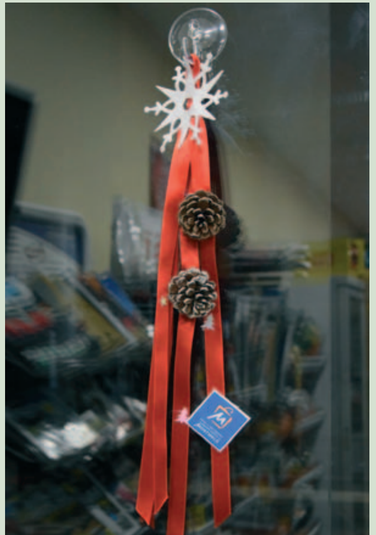
Los establecimientos de la UBCM lucen durante estos días, el recuerdo navideño elaborado por el Trencadís