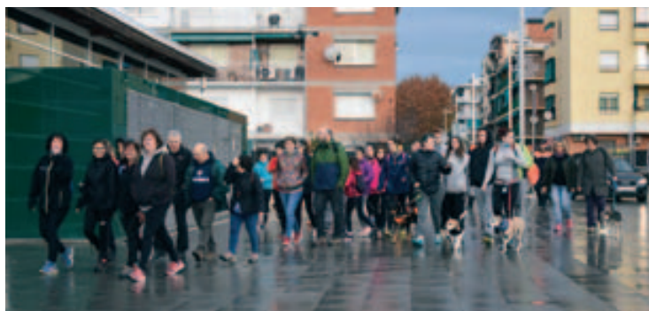
Caminata Solidaria organizada por el Montmeló Club Basquet