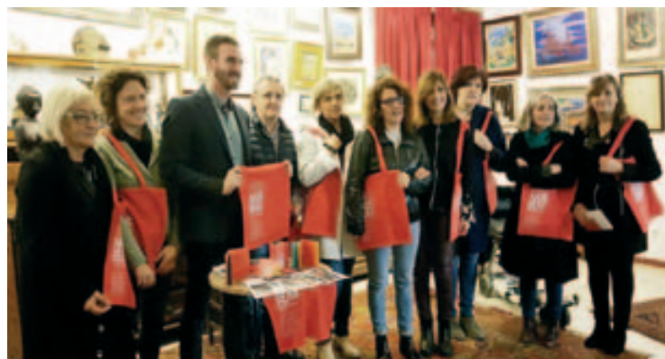
Acto de presentación del Passmuseum en la casa del pintor Abelló de Mollet del Vallès

Este programa se ha concretado en la edición del libro Passmuseum que, en forma de pasaporte, recoge la oferta de cada uno de los museos participantes, la que se puede complementar con