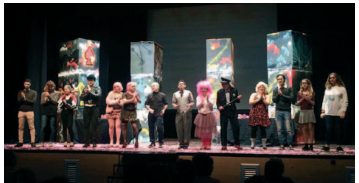
Els Pastorets 2018 a la Sala Polivalent