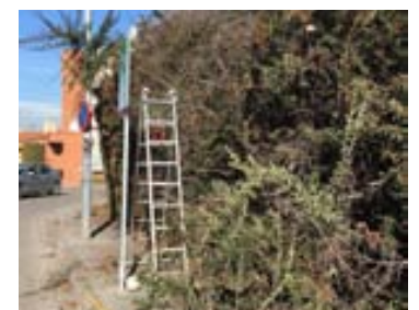
Retallada de la tanca del carrer Lluís Companys (Sant Jordi)