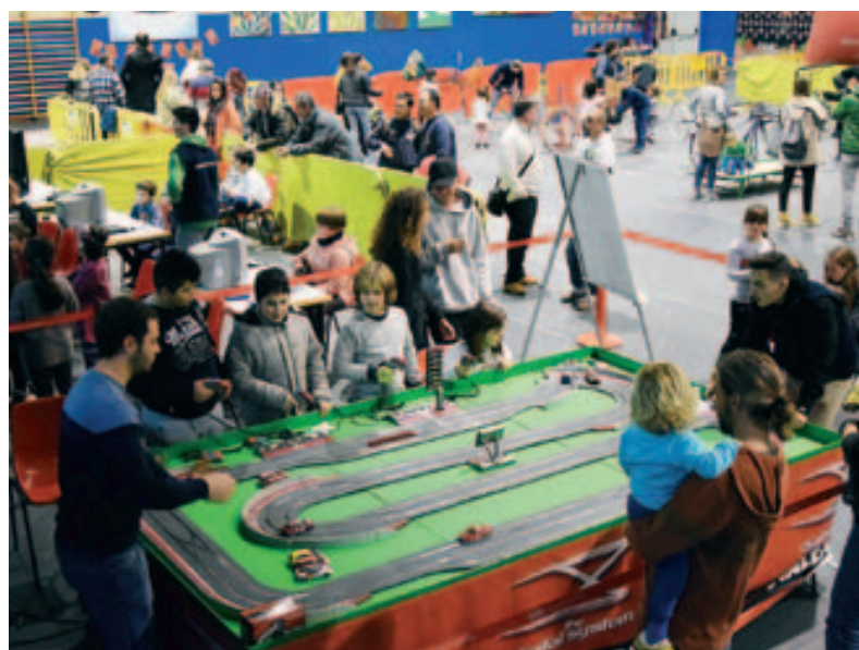
Parc de Nadal: competició d'Escalectric