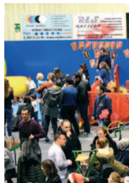
Parc de Nadal: espai central