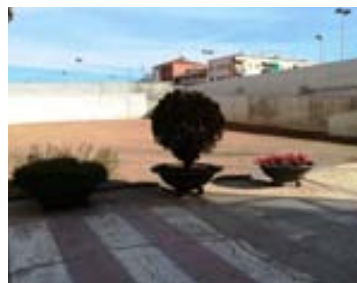
Col·locació de jardineres a la plaça de l'Estació Jove