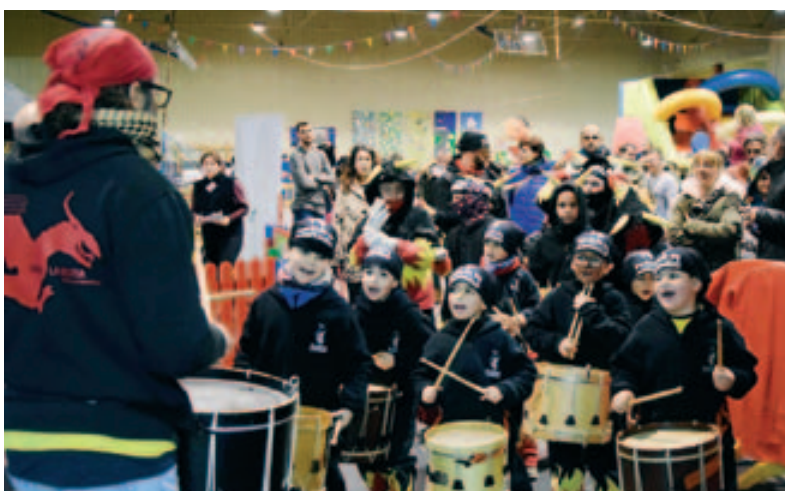
Parc de Nadal: colla infantil de Diablers