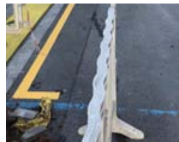
Repintat de zones gual, pas vianants i zona taronja