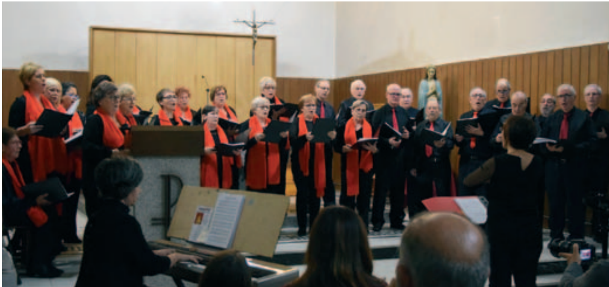
Concert de la Coral de l'Agrupació, a l'església de Sant Maria