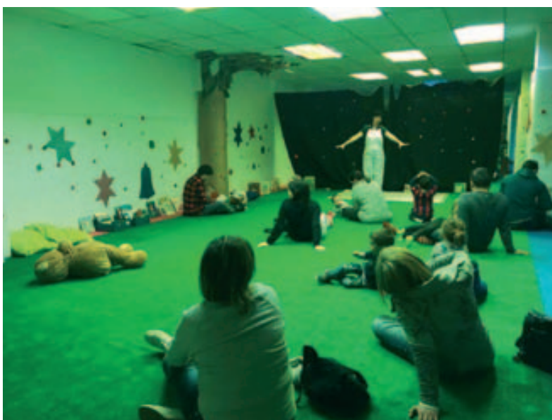
Parc de Nadal: l'hora del conte