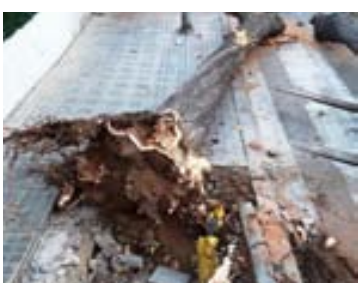
Retirada arbres al carrer i passatge Pintor Mir