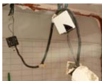
Reparació de la caldera del casal de la Gent Gran