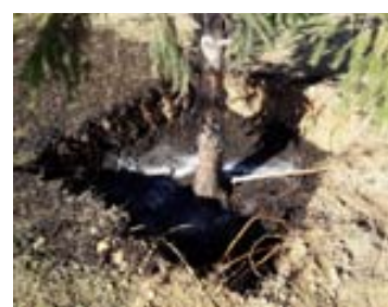
Transplantament d'un arbre del carrer de Lluís Companys a la zona verda del Cementiri