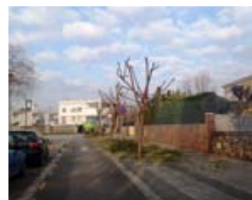
Inici poda carrer Navarra