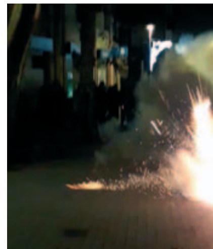
Traca d'inici d'Any al carrer Major