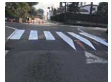
Repintat pas de vianants a diferents carrers del municipi