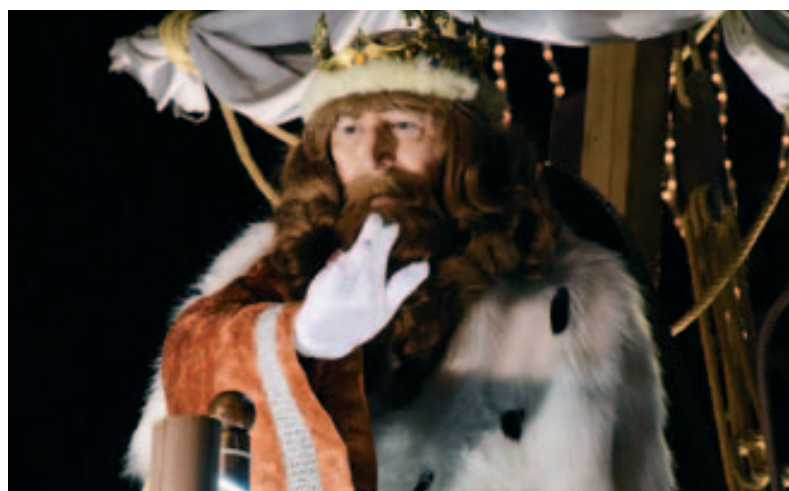
Cavalcada de Reis