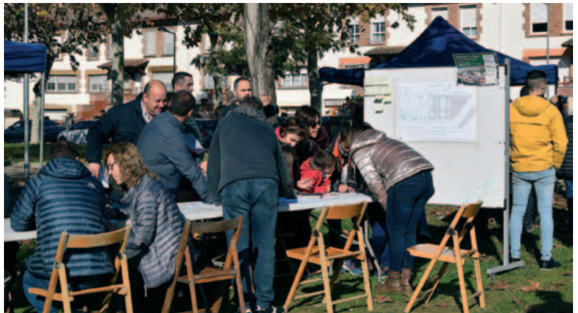
Taller participatiu a la plaça de la Constitució