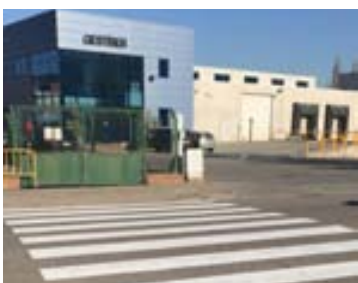
Nou pas de vianants per accedir a la passera Simon Rosado