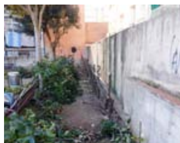
Eliminació tanca de la plaça Pablo Picasso