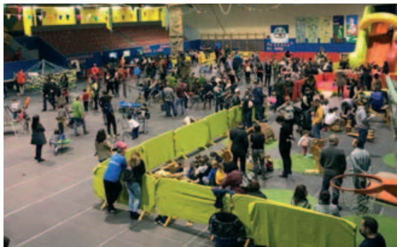
Parc de Nadal: vista general