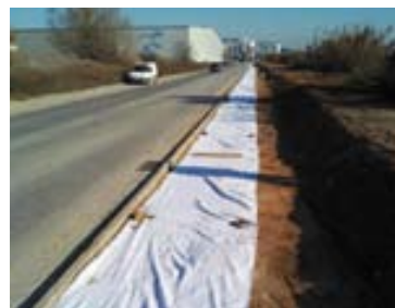
Col·locació de malla geotèxtil al passeig del riu Besòs