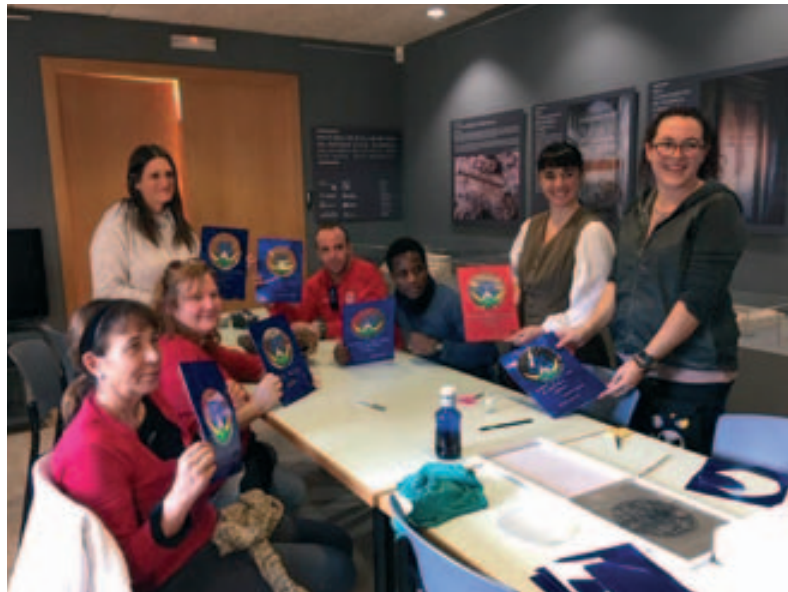
Taller de nades al Museu Municipal de Montmeló