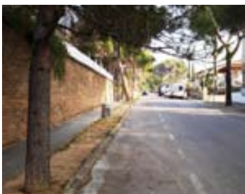
Instal·lació de papereres a l'avinguda Vilardebó