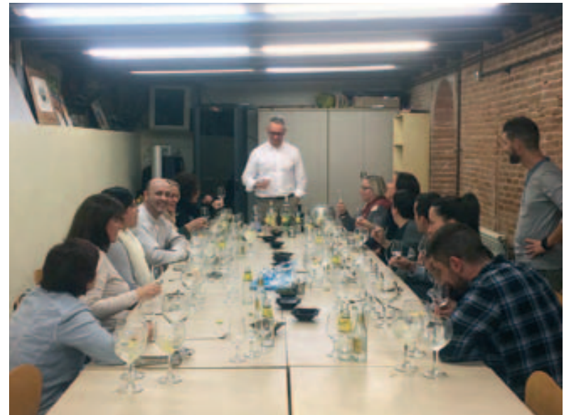
Taller de gintònics al Centre Cultural La Torreta