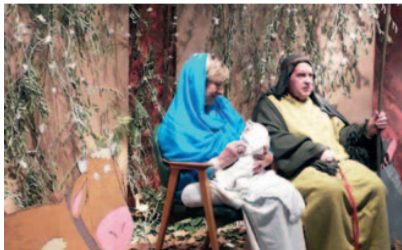
Pessebre vivent al Casal de la Gent Gran