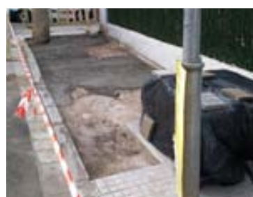
Col·locar panots als carrers i passatge Pintor Mir