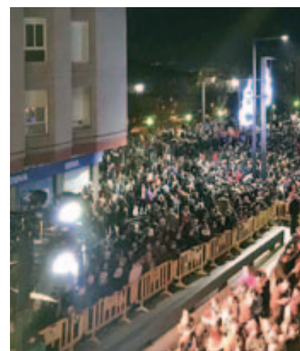
La Plaça de la Vila plena per rebre al Rei