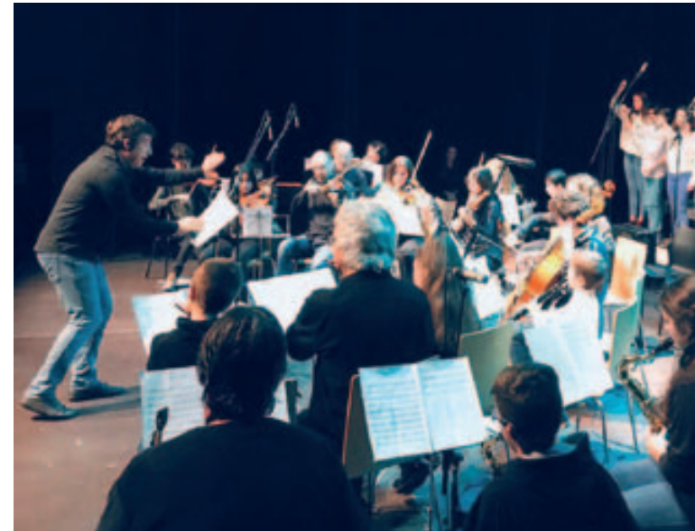
Concert de Nadal de l'Escola Municipal de Música a la Sala Polivalent