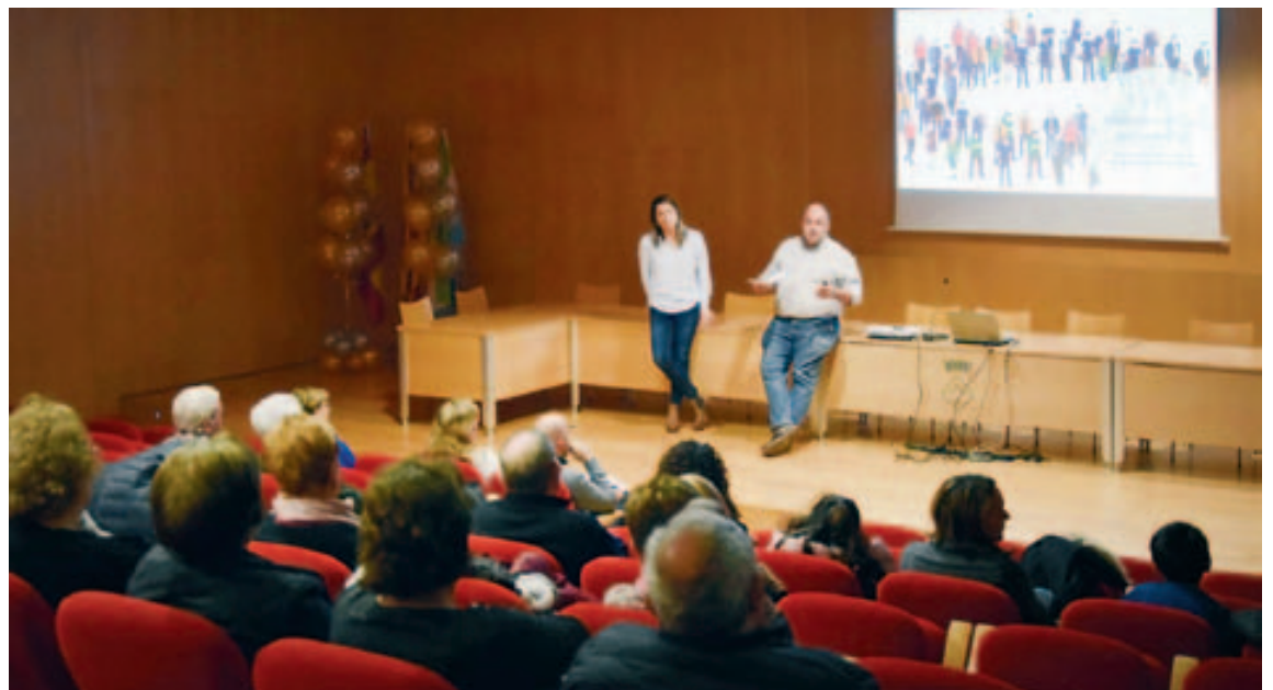
Presentació dels projectes fins del parc del Sant Crist