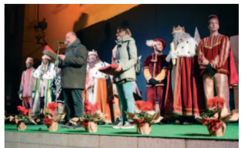
Parlament de benvinguda al Reis d'Orient