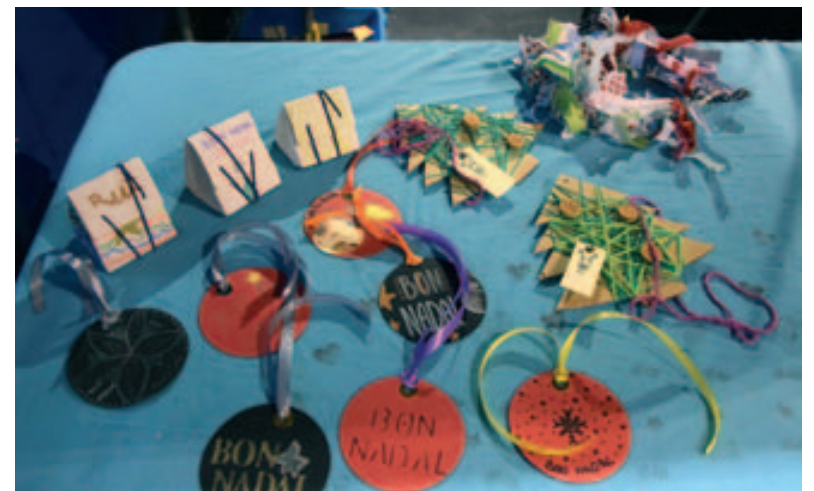
Parc de Nadal: taller de manualitats reciclades de Corbion