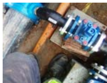
Instal·lació contra incendis nau al Camí Antic de Can Guitet