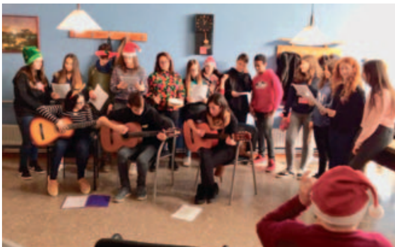
Nadales dels alumnes de l'Institut al Casal de la Gent Gran