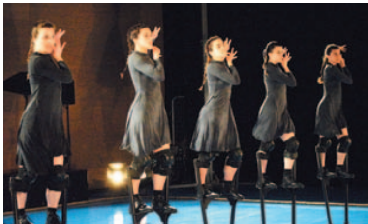
Un momento del espectáculo Mul·ler

Las actividades conmemorativas del Día internacional de las mujeres continuarán durante el fin de semana. 120 espectadores acudieron el sábado por la tarde a la sala Polivalente, para presenciar el espectáculo Mul·ler . Un espectáculo de danza contemporánea realizado por cinco mujeres sobre zancos. Una increíble demostración de fuerza, sentimiento, maestría y técnica, acompañados de una soberbia música que mantuvo en vilo a la platea durante 50 minutos maravillosos. Como era de esperar, el público despidió la compañía Maduixa Teatre con una larga y sonora ovación