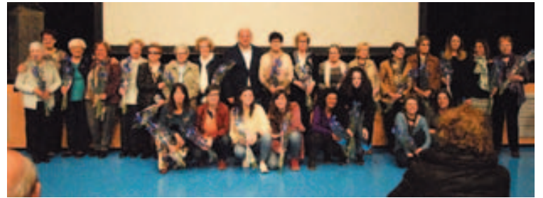
Foto de grupo de las mujeres que participaron en el documental Veus de dona

nacional de las Mujeres fue la sesión de cuentos adultos de Rosa Fité con el título Spa Mocions , que tuvo lugar el domingo por la tarde en la Sala de la Concordia. Por último reseñar que durante esta semana aún se puede ver la exposición sobre María Aurèlia Capmany en la Biblioteca Municipal. ■