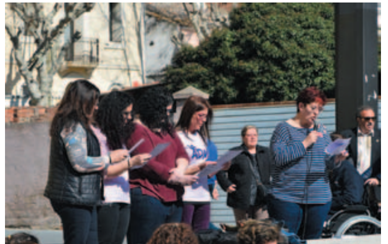
Lectura del manifiesto del Día Internacional de las Mujeres