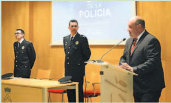
Parlamento el pasado 16 de marzo, Día de la Policía Local

En cualquier pueblo o ciudad constantemente suceden hechos que ponen en peligro la seguridad ciudadana. No es algo que nadie quiera saber, leer o escribir, pero es exactamente lo que