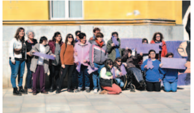
Mujeres del Trencadís al frente de la concentración