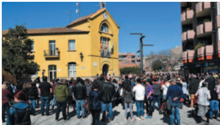
8 de marzo: Concentración feminista en la plaza de la Vila

La concentración feminista tiñó de color lila la plaza de la Vila. La ovación de la jornada fue para el grupo de mujeres del Centro Ocupacional del Trencadís que también quisieron estar en primera fila de la concentración y reivindicaciones del día. Esta movilización se enmarcaba dentro de los actos programados en el fin de semana días 8, 9 y 10 de Marzo en el municipio para hacer visible la necesidad de trabajar por la igualdad en la sociedad.