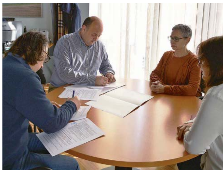
Firma del convenio de col·laboració del projecte “Aprèn i treballa”

La participación de los usuarios en el proyecto se plantea de forma gratuita,