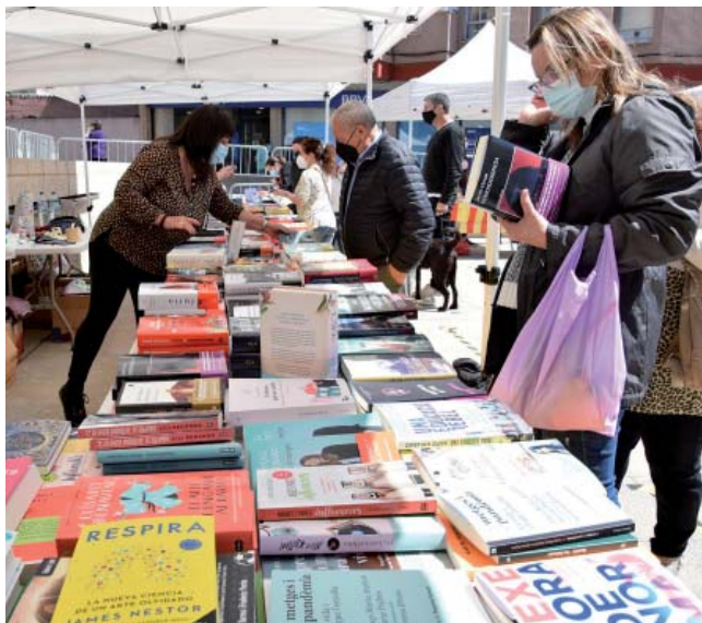
Parada de llibres a la plaça de la Vila

La tertúlia es va convertir en un espai de retrobada amb els personatges de la seva novel·la: No soc aquí, Premi Anagrama de novel·la en català l'any 2020. L'autora va valorar els llocs, les situacions i circumstàncies que van permetre crear la història familiar de la Mila, filla de pagesos, identificada fidelment amb els seus orígens i amb la cerca d'un espai personal. Una dona conscient de la seva capacitat d'adaptació per superar els