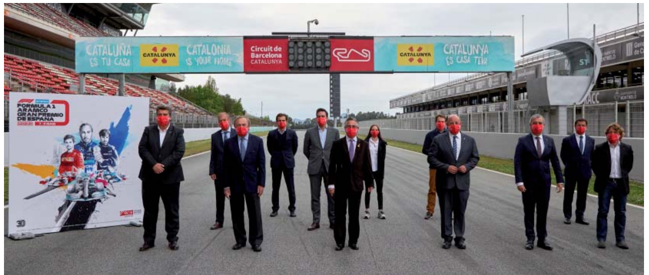
Presentació del Formula 1 Aramco Gran Premio de España 2021. Autoritats i organització

D'entre tots els escolars d'11 i 12 anys, es van triar deu preguntes, totes elles en anglès. Els pilots del Mundial d'F1 van escoltar atentament i van respondre aquestes preguntes en l'habitual roda de premsa que se celebra cada dijous abans de Gran Premi, ja que es van emetre en vídeo cadascuna d'elles. Les preguntes van ser d'allò més variades i creatives.