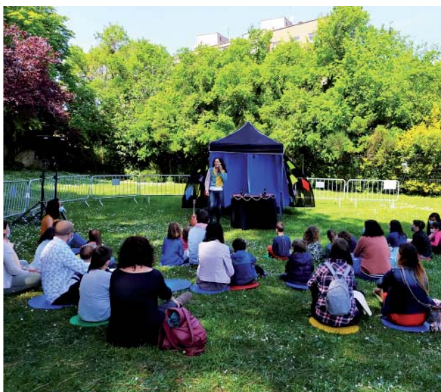
25è aniversari de la Biblioteca. Activitat familiar a la Torreta