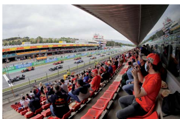
1000 socis van presenciar el Gran Premi automobilístic