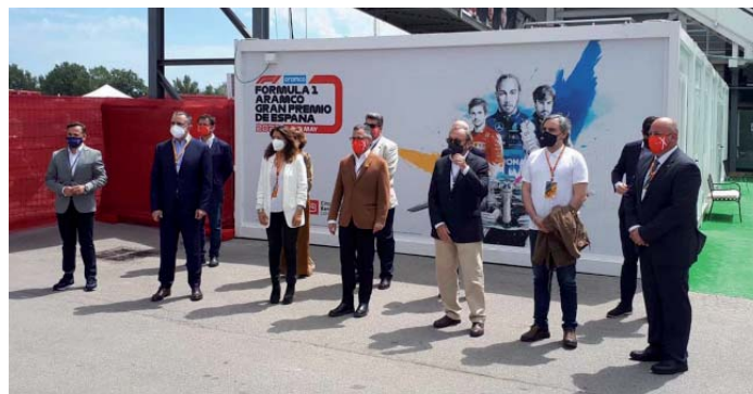
Autoritats i organització presents en el Gran Premi de Fórmula 1