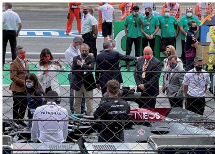
Visita oficial per la pista i boxes abans de la cursa