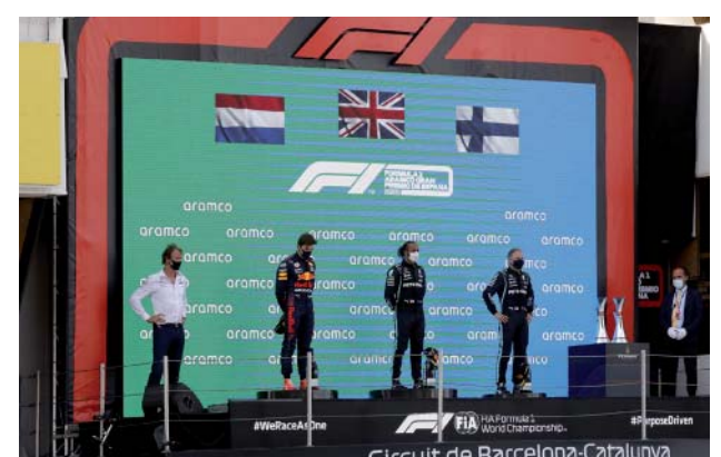
El pòdium amb L. Hamilton com a guanyador