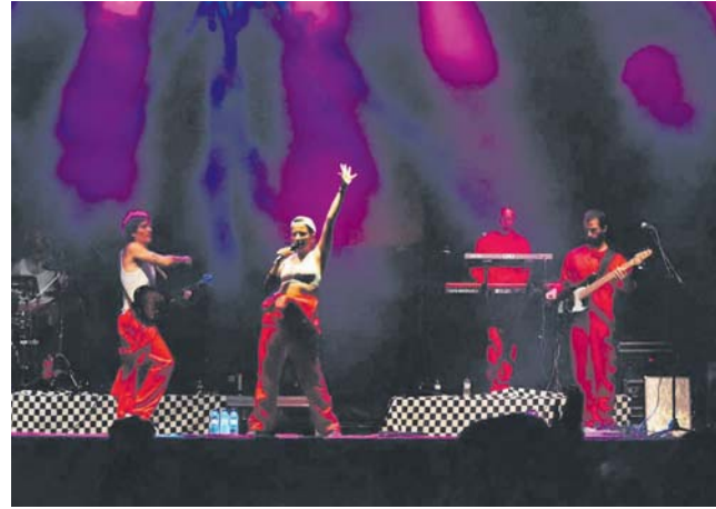
Concert de la Banda del Coche Rojo al Mil·lenari