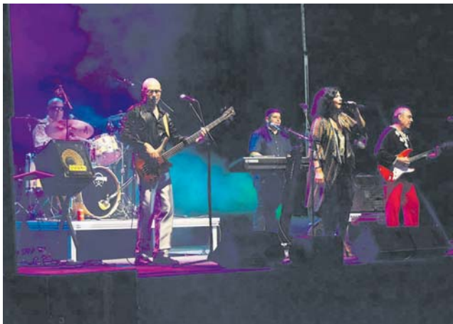
Concert del Guateque a La Torreta