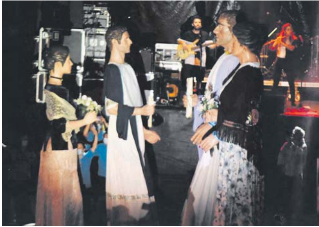
Presentació dels nous Gegants de Montmeló