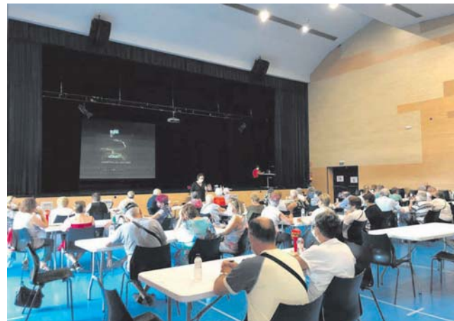
Sessió de Bingo a la Polivalent