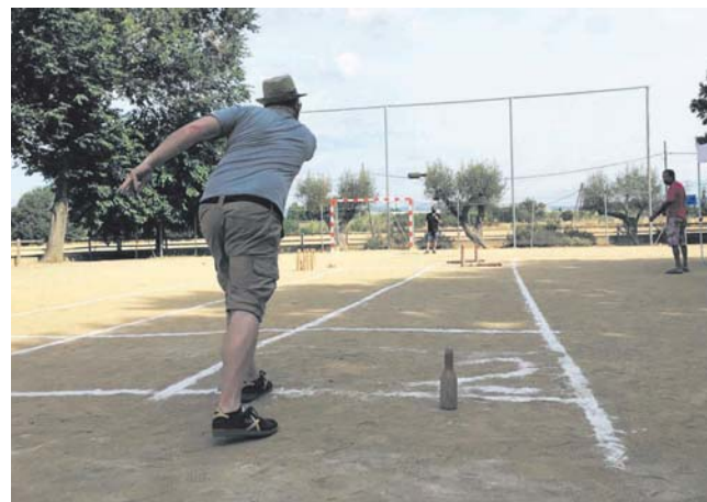
Iniciació a les bitlles catalanes al parc del Sant Crist