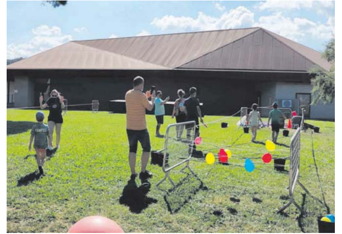
Mercat de Xauxa als jardins de La Torreta