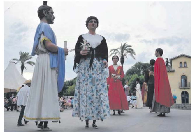
40a trobada de Gegants a La Quintana