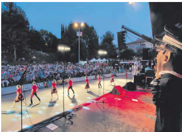
Espectacle d'inici de festa. Montmeló esclata!

Visca Montmeló! Visca la Festa Major! Fins l'any vinent!