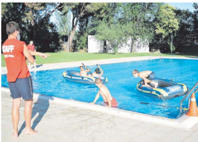
Gimcana Xip-Xap a la Piscina