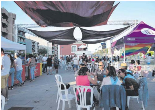
Montmeló Sunset a la Llosa