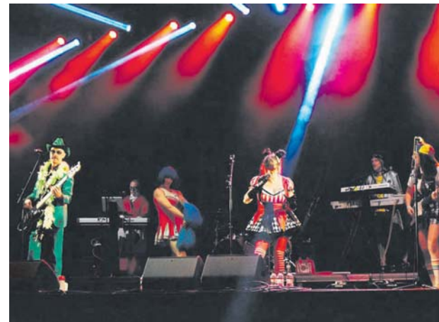
Concert de La Loca Histèria al Mil·lenari