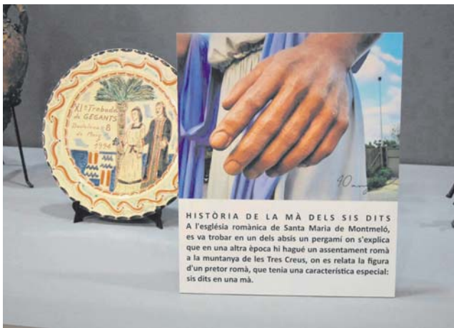
Exposició 40 anys de gegants en imatges al Museu Municipal