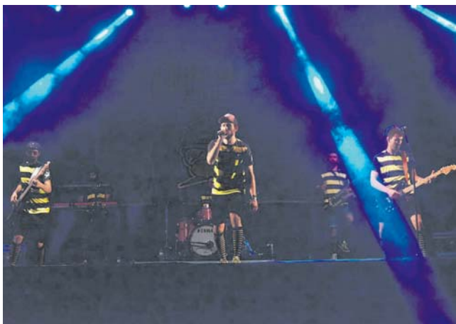
Concert de la Dalton Bang al Mil·lenari