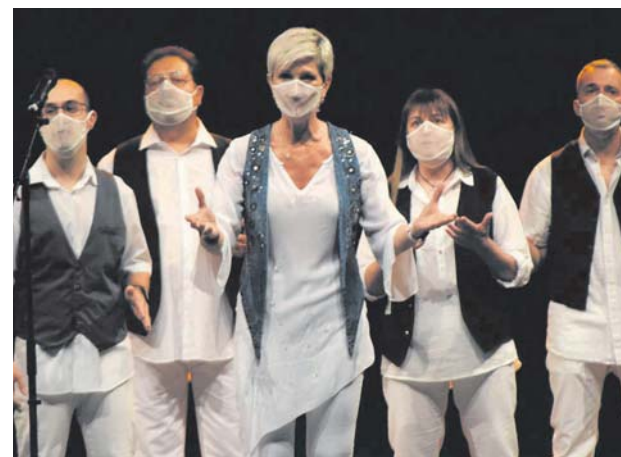
Concert de Gòspel a la Polivalent