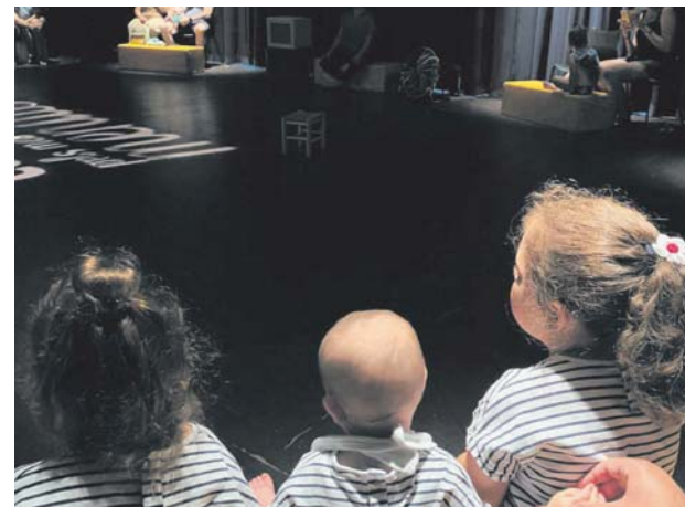
Espectacle per a nadons Söns, a la Polivalent