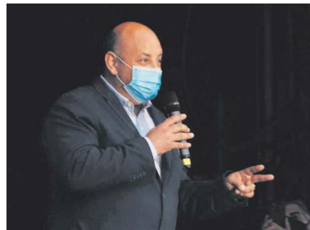
Salutació de Festa Major de l'alcalde Pere Rocríguez