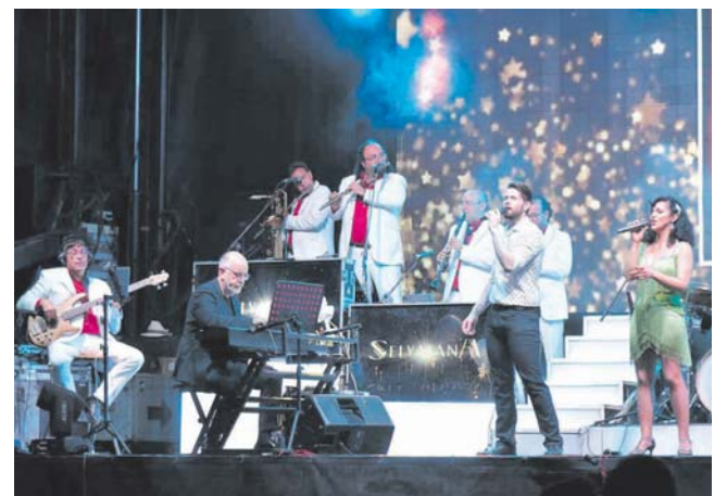
Concert ball de fi de festa al Mil·lenari