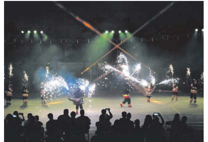
Llum Foc Esperança, espectacle de foc dels Diables