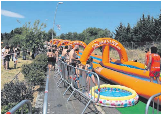
Tobogan aquàtic al Turó de la Bandera