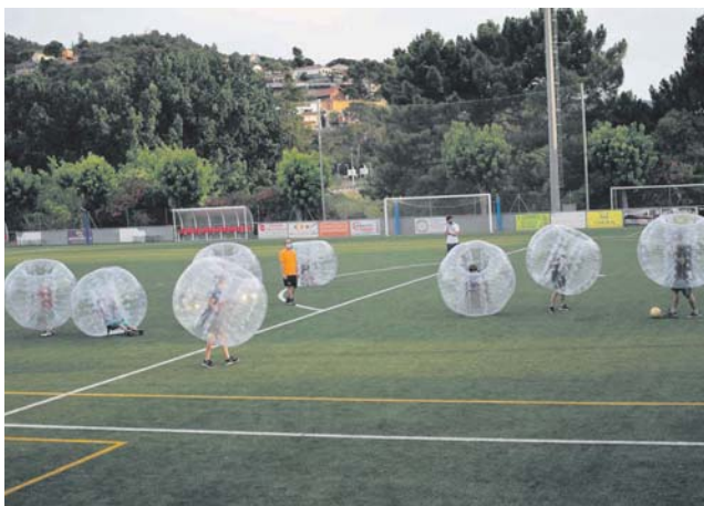
Partit de futbol bombolla