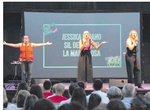
Espectacle Calladitas estéis más guapas a La Torreta