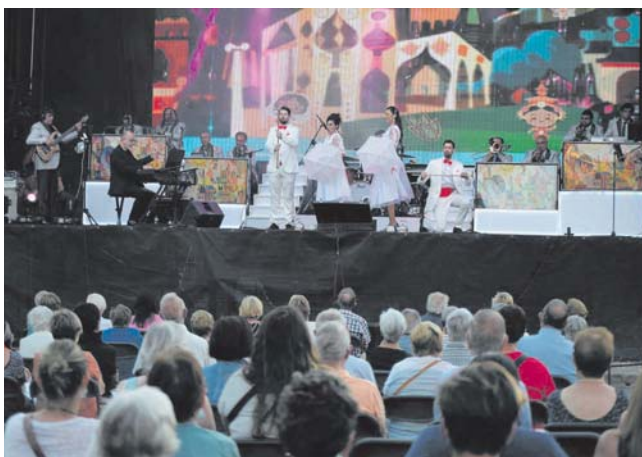
Concert de Festa Major de La Selvatana