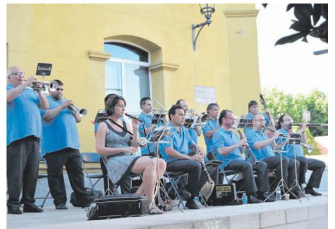
Concert de sardanes a la plaça de la Vila