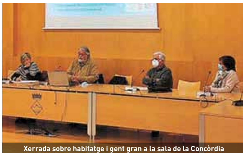
Xerrada sobre habitatge i gent gran a la sala de la Concòrdia