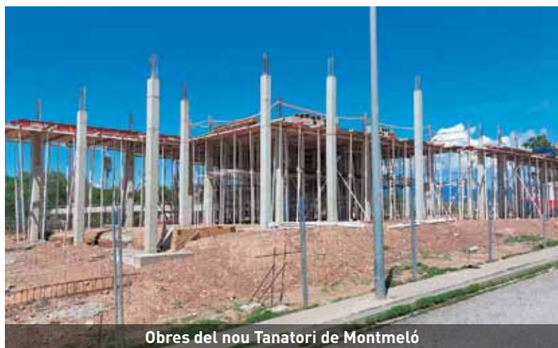
Obres del nou Tanatori de Montmeló