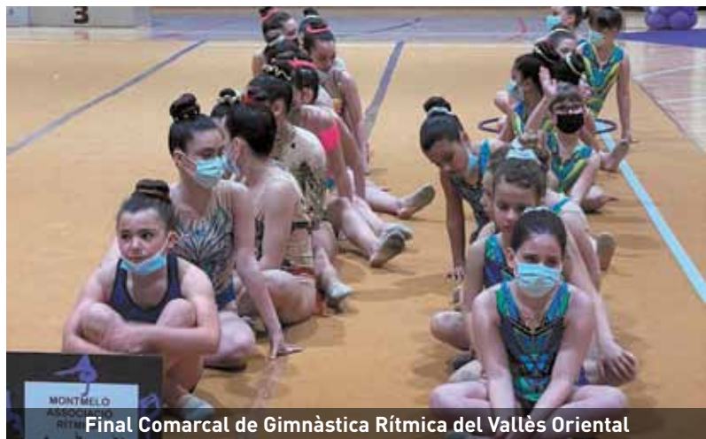
Final Comarcal de Gimnàstica Rítmica del Vallès Oriental