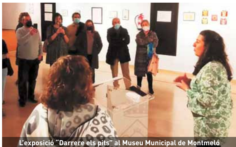
L'exposició "Darrere els pits" al Museu Municipal de Montmeló