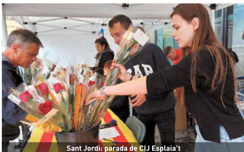
Sant Jordi: parada de CIJ Esplaia't