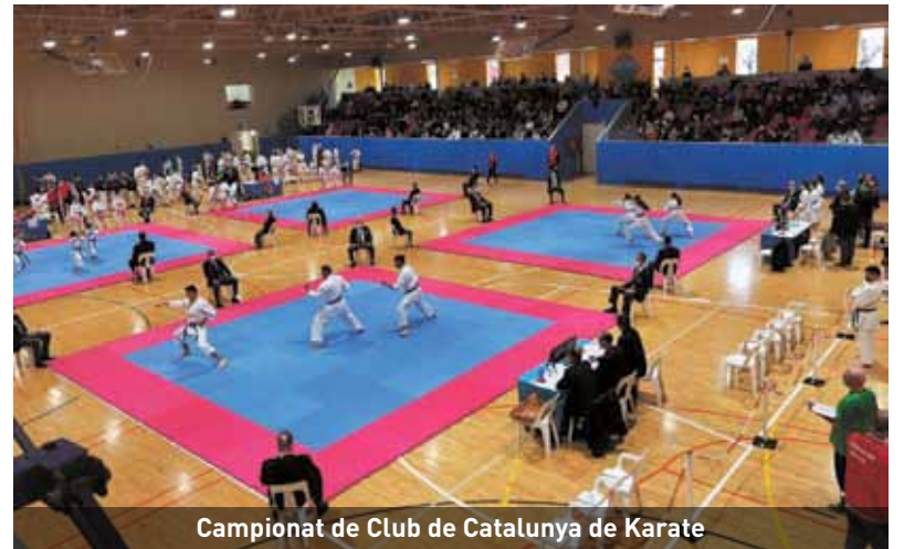
Campionat de Club de Catalunya de Karate