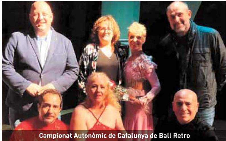
Campionat Autònom de Catalunya de Ball Retro