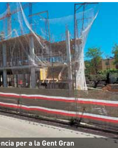
...ncia per a la Gent Gran