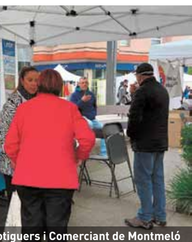
...otiguers i Comerciant de Montmeló