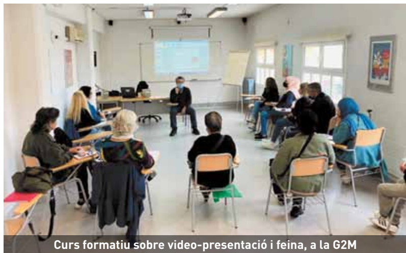
Curs formatiu sobre video-presentació i feina, a la G2M