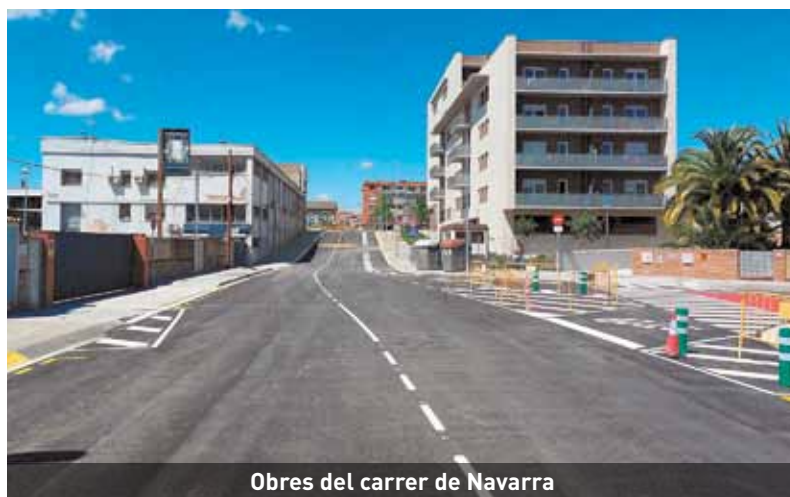
Obres del carrer de Navarra