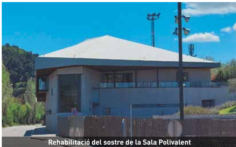
Rehabilitació del sostre de la Sala Polivalent