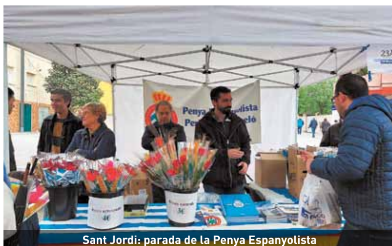
Sant Jordi: parada de la Penya Espanyolista