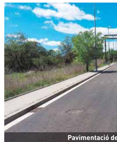
Pavimentació de la nova residència