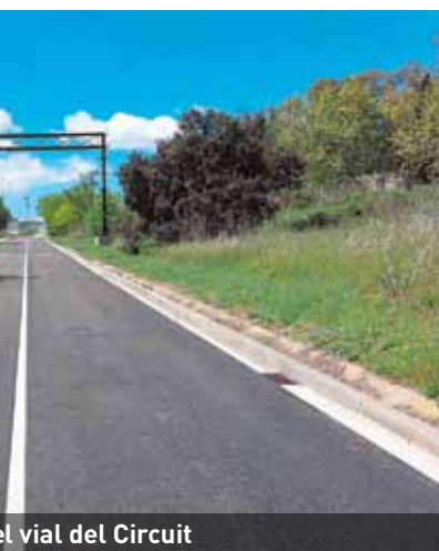
...el vial del Circuit