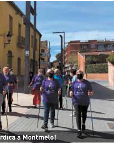
...rca a Montmelo!