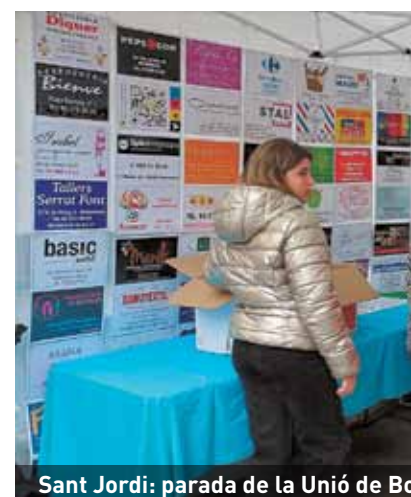
Sant Jordi: parada de la Unió de Barri