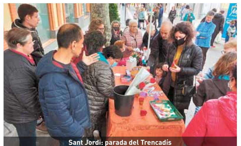
Sant Jordi: parada del Trencadís