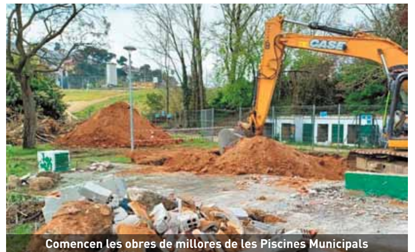
Comencen les obres de millores de les Piscines Municipals