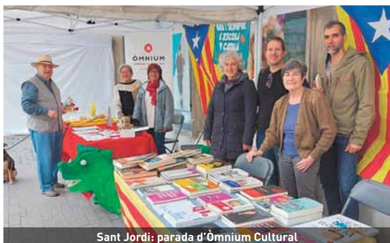
Sant Jordi: parada d'Òmnium Cultural