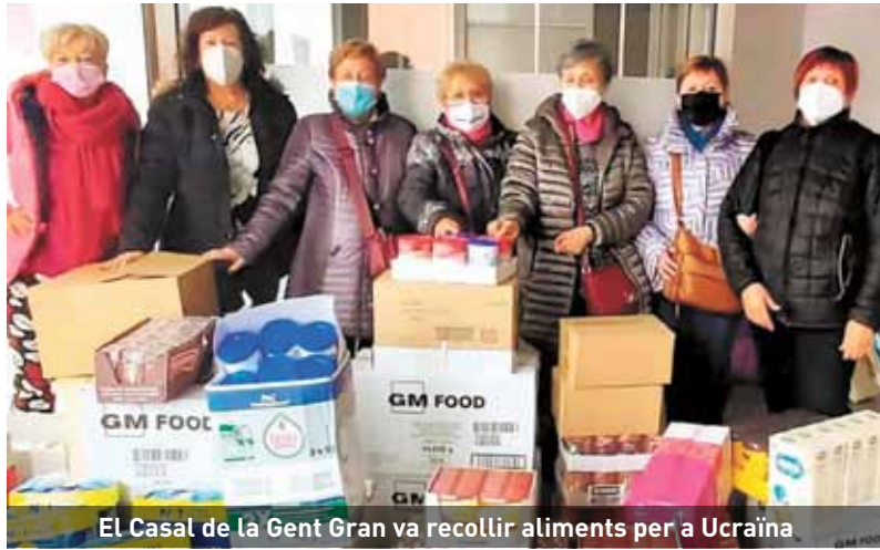
El Casal de la Gent Gran va recollir aliments per a Ucraïna