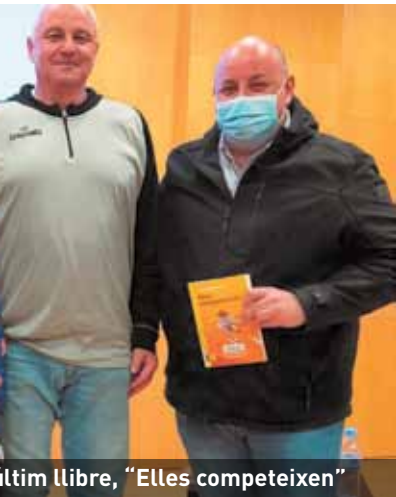
...ltim llibre, "Elles competeixen"