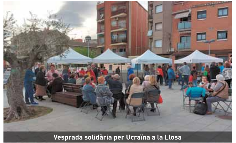
Vesprada solidària per Ucraïna a la Llosa