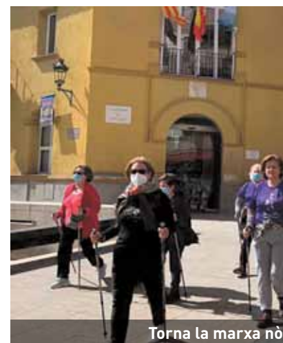
Torna la marxa nòrdica