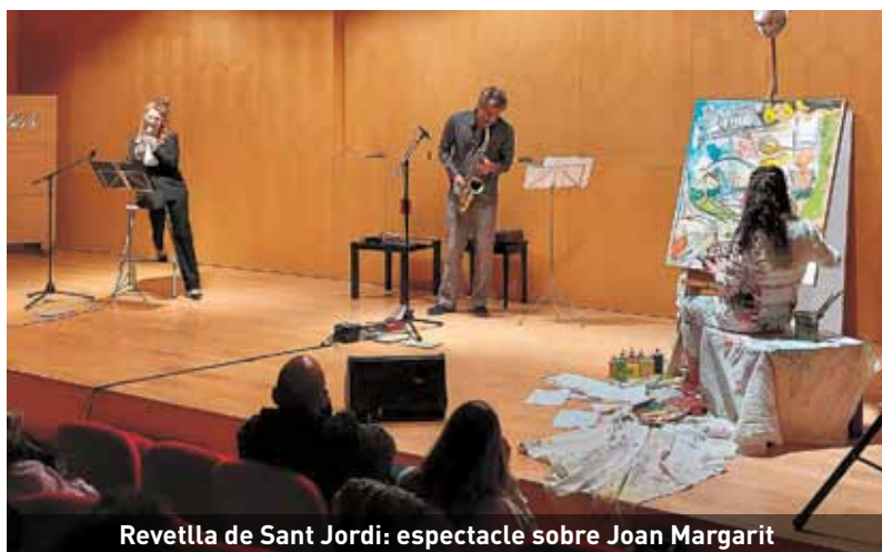
Revetlla de Sant Jordi: espectacle sobre Joan Margarit