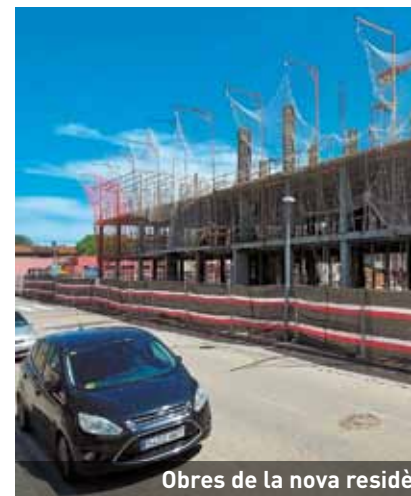
Obres de la nova residència