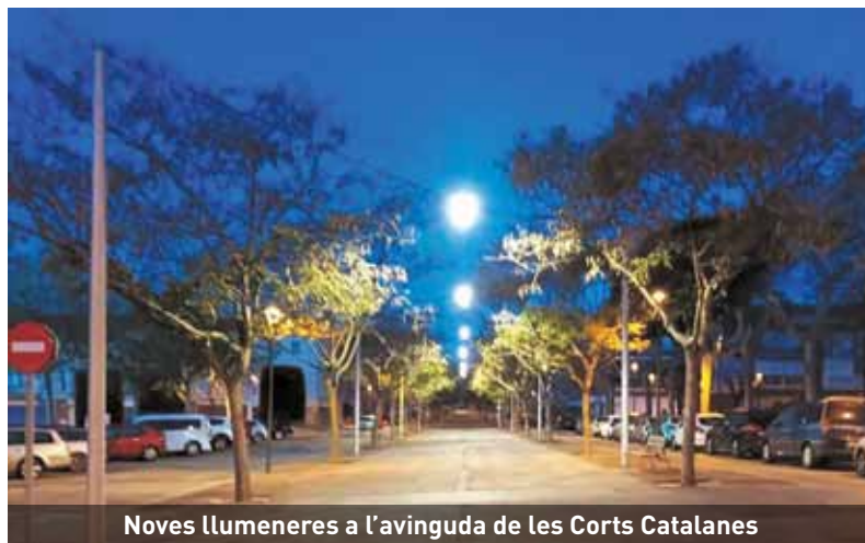
Noves llumeneres a l'avinguda de les Corts Catalanes