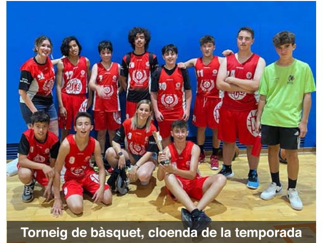
Torneig de bàsquet, cloenda de la temporada