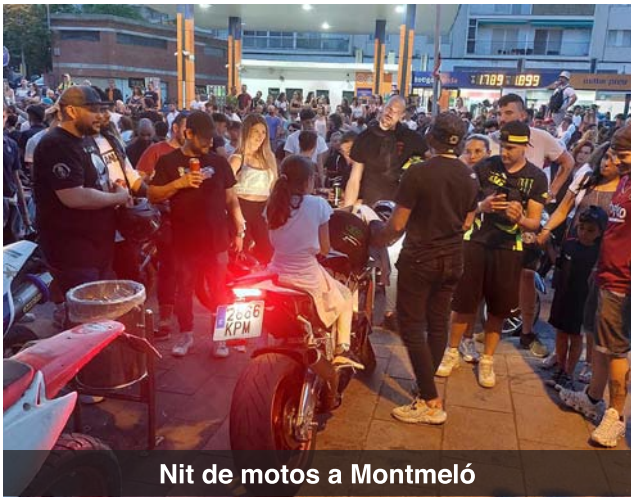
Nit de motos a Montmeló