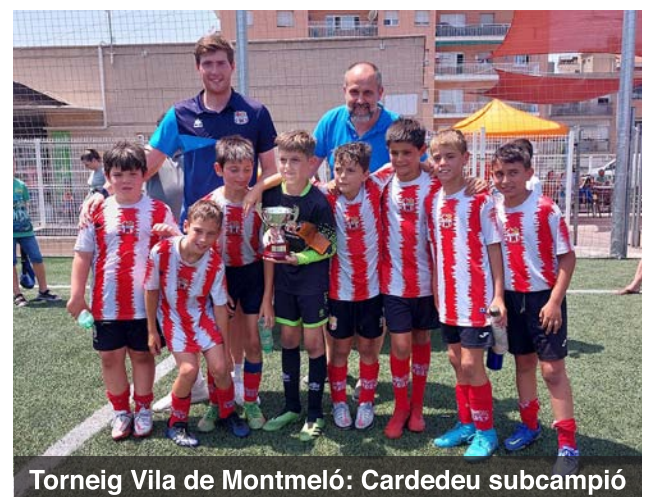
Torneig Vila de Montmeló: Cardedeu subcampió