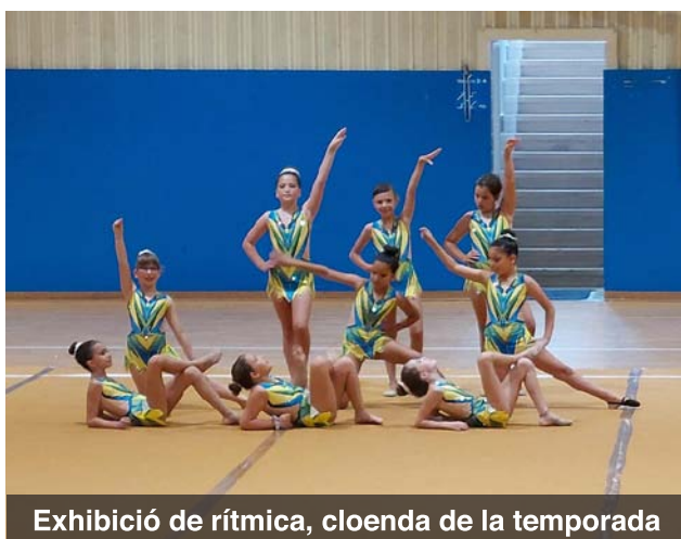
Exhibició de rítmica, cloenda de la temporada