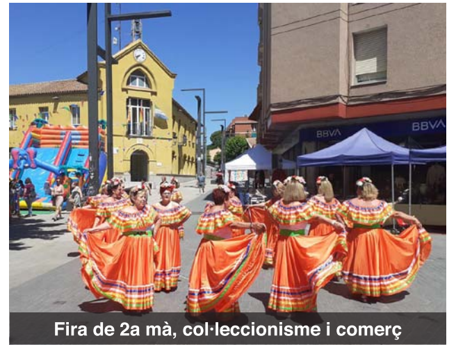
Fira de 2a mà, col·leccionisme i comerç