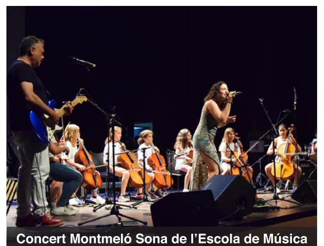
Concert Montmeló Sona de l'Escola de Música