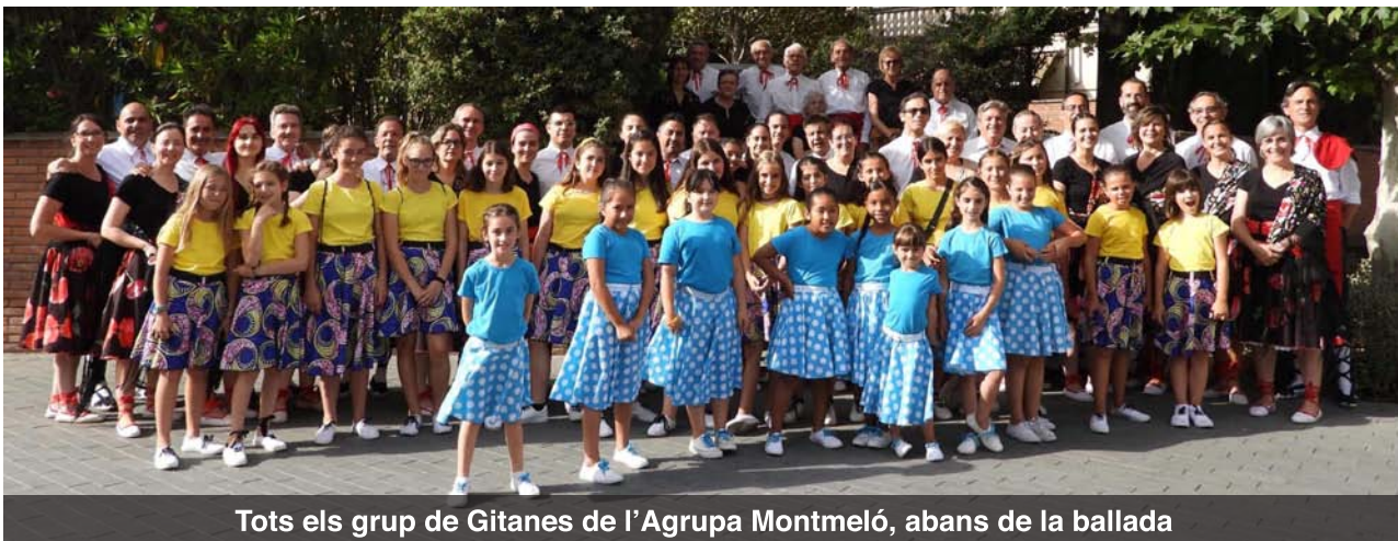
Tots els grup de Gitanes de l'Agrup Montmeló, abans de la ballada