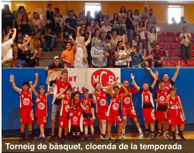
Torneig de bàsquet, cloenda de la temporada