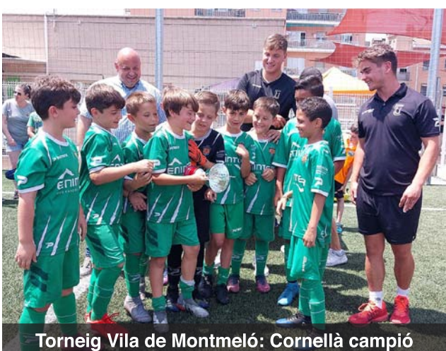
Torneig Vila de Montmeló: Cornellà campió