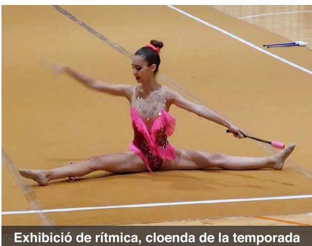
Exhibició de rítmica, cloenda de la temporada