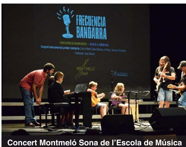
Concert Montmeló Sona de l'Escola de Música