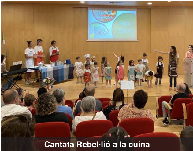
Cantata Rebel·lió a la cuina